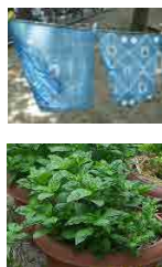
橋公園で藍を栽培中