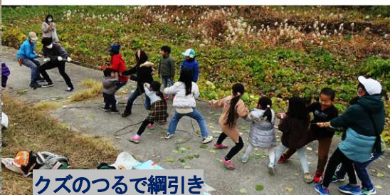
クズのつるで綱引き