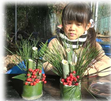
自然林でミニ門松を作りました